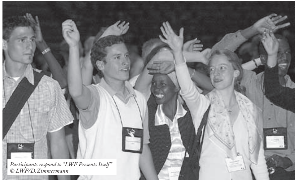
Participants respond to "LWF Presents Itself"

For most participants at an LWF Assembly, stewards are the helping hands that make the most obscure documents appear miraculously.