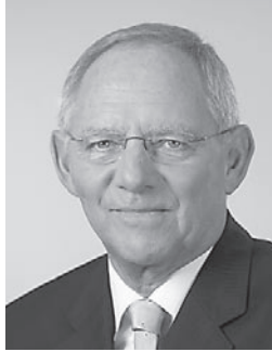
Dr. Wolfgang Schäuble.

Schäuble übt seit 2009 das Amt des Finanzministers aus. Zuvor war er Innenminister und in früheren Jahren Chef des Bundeskanzleramts. Er absolvierte