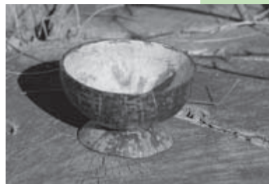
A sample of the Mozambican bowls to be shared at the Eleventh Assembly in Stuttgart, Germany.

To make the bowls, the empty coarse shell is soaked in water for 24 to 28 hours, and then scraped until smooth. It is cut proportionately with the upper wide side as the brim, and the lower smaller one as the base. Both portions are glued together and then polished and varnished to make the bowl. It can take four days to make one bowl, used in Mozambique for drinking and holding liquids.